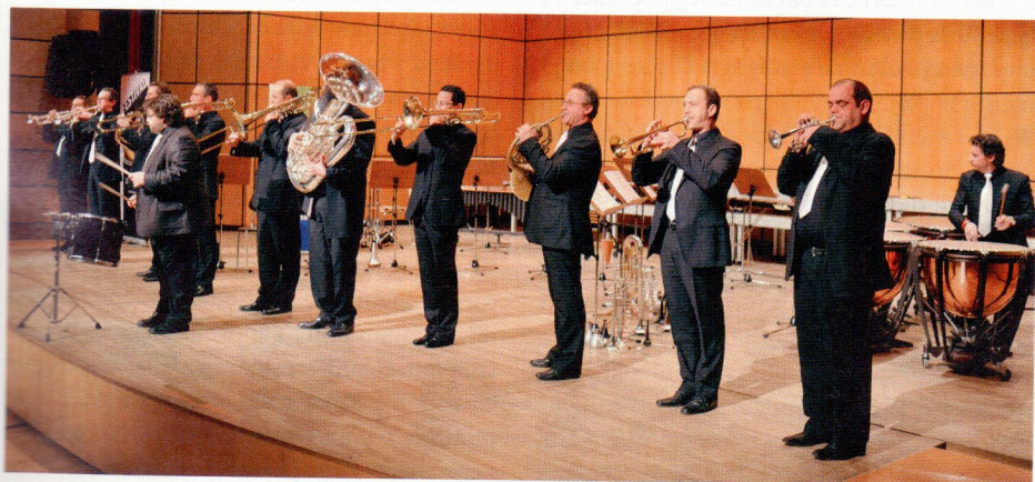
Lors d'un des concerts donnés lors de la 1 ère édition du Festival de cuivres de Genève.

Le troisième axe du Festival offre la possibilité à des étudiants du conservatoire ou à des groupes amateurs (harmonies ou fanfares) de se produire en public sous la forme d'aubades pour précéder les grandes formations. La salle Frank-Martin ainsi que le Temple de la Fusterie et le Conservatoire de musique accueilleront la manifestation. A noter encore que l'émission du «Kiosque à musiques» de la Radio romande sera diffusée en direct sur les ondes de La Première le samedi 29 janvier. Pour plus d'infos, consulter le site Internet de la manifestation dont l'adresse est la suivante: http://www.genevabrassfestival.ch/ .